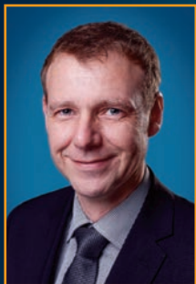
Markus Schäfer Bürgermeister